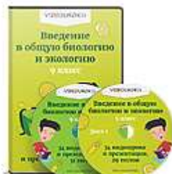
Введение в общую биологию и экологию 9...