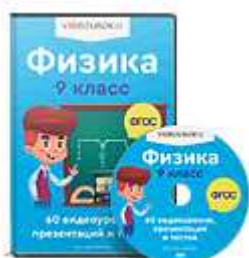
Физика 9 класс ФГОС