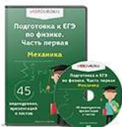
Подготовка к ЕГЭ по физике. Часть 1...