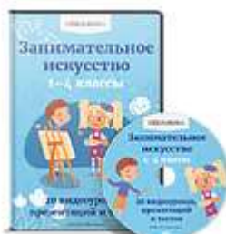
Занимательное искусство 1-4 классы