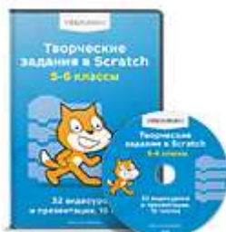
Творческие задания в Scratch 5-6 классы